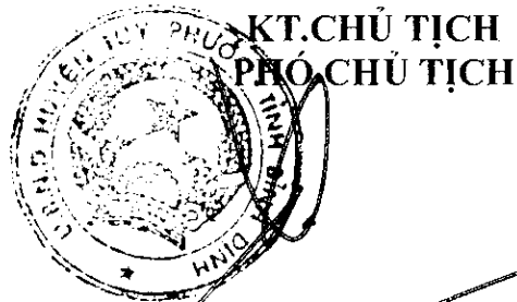
Trần Hữu Lộc