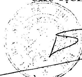
Hồ Quốc Dũng