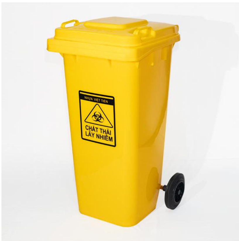
Hình 5: Thùng chứa rác nguy hại chuyên dụng 120 lít (màu vàng)