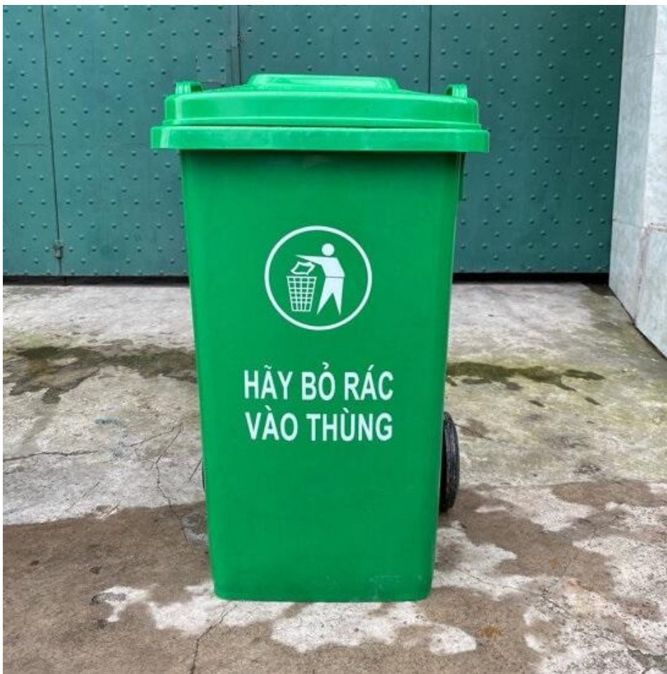
Hình 4: Thùng chứa rác chuyên dụng 240 lít