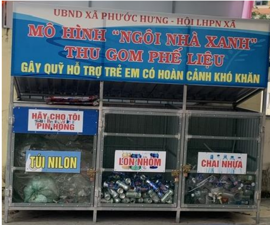
Hình 2: Ngôi nhà xanh chứa rác thải để tái sử dụng, tái chế

3.2.2. Đối với rác thải thực phẩm (thức ăn thừa, rau, củ, quả, xác động vật, vỏ trứng, vỏ sò, bã trà, bã cà phê...): dùng thùng ủ rác để xử lý rác thải, sau một thời gian rác mục sử dụng làm phân bón tại các hộ gia đình.